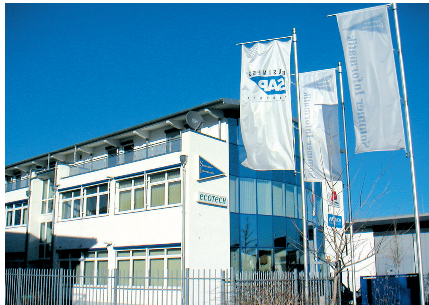
Das SI-Firmengebäude in Rosenheim/Schwaig

Verkehrsgenossenschaft mit „Capitol Passage“ alle im S- und U-Bahnbereich der Stadt Berlin angesiedelten Ladengeschäfte. Aufgrund dieser zahlreichen Projekte floss im Laufe der Jahre viel Know-how in Capitol Classic ein – die ursprünglich klassische Hausverwaltungssoftware entwickelte sich dadurch zu einem Produkt, das am Besten als „ERP-System für die Immobilienwirtschaft“ zu charakterisieren ist. Entsprechend interessiert zeigen sich deshalb auch Großkunden: erst kürzlich wurde die Lösung bei einem großen Maschinenbaukonzern in Oberhausen eingeführt.